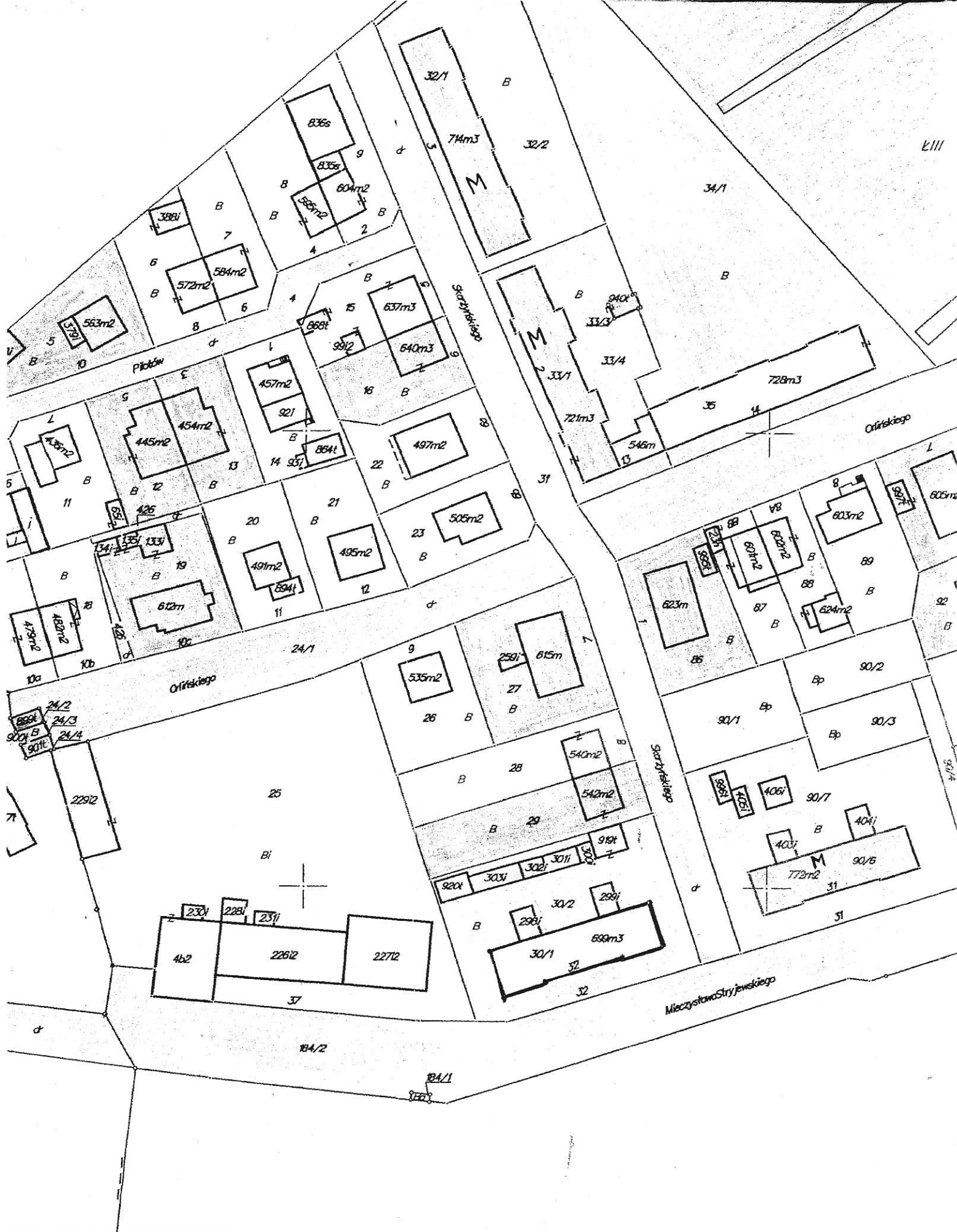
Mapa ewidencji gruntów i budynków